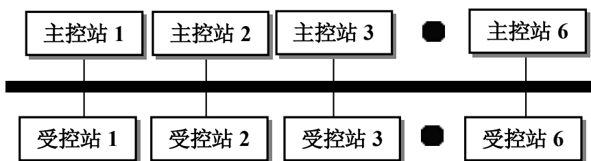
图 1 系统结构

本系统用来监控杭州、温州、宁波等城市的微波站，主控站在城市机房，受控站则在内地或海边的山顶，环境比较恶劣。共有 6 个主控站，每个主控站带 1 个受控站，采用总线型的主控机和受控机两级结构，通过微波信道(图 1 粗黑线所示)在主控机之间传送数据，但在某一时刻只有一台主控机 Polling 所属受控机，被 Polling 受控机作应答处理，其余主控机处于侦听(Listen)状态。主控机 Polling 完所属受控机后，转移 Polling 权，由下一台主控机接管 Polling 权……如此循环。监控内容主要包括柴油发电机、开关电源、市电、蓄电池等的工作状态、环境温度、湿度、防盗等。系统结构如图 1 所示。